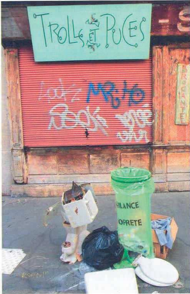
Dans une rue de Paris