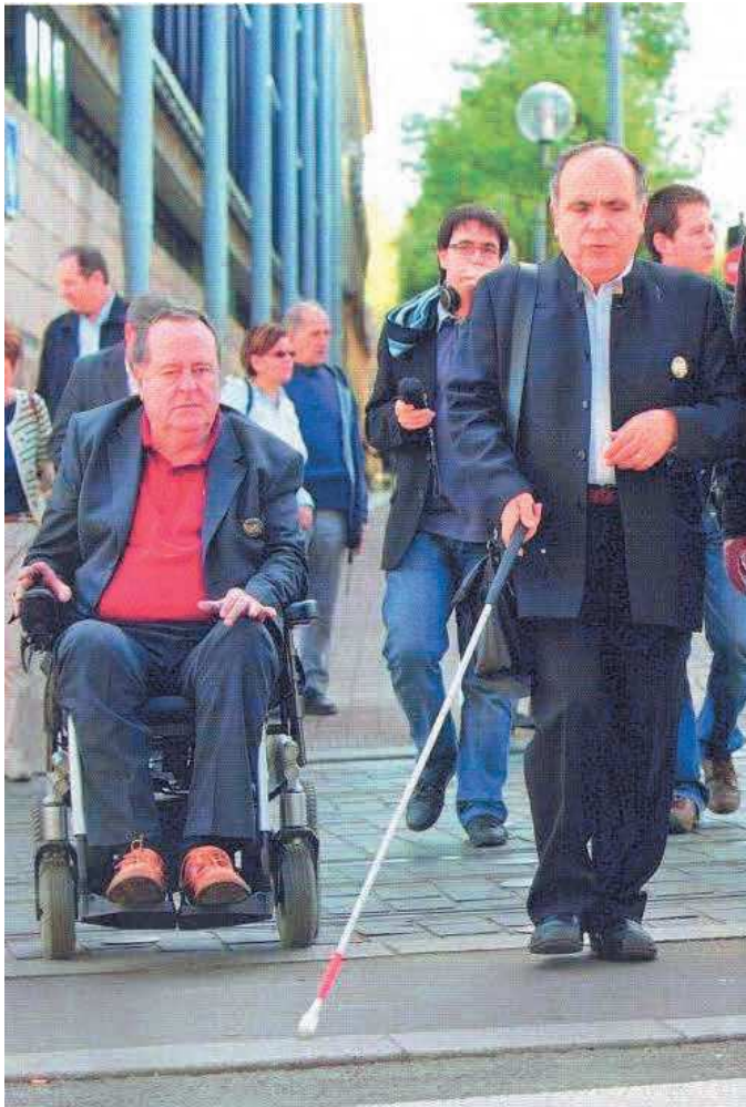
Premier tour de France de l'accessibilité avec Vincent Michel, président de la Fédération française des aveugles et handicapés visuels de France, Bordeaux, le 5 avril 2011

Le développement durable consiste aussi à rendre la vie quotidienne plus agréable