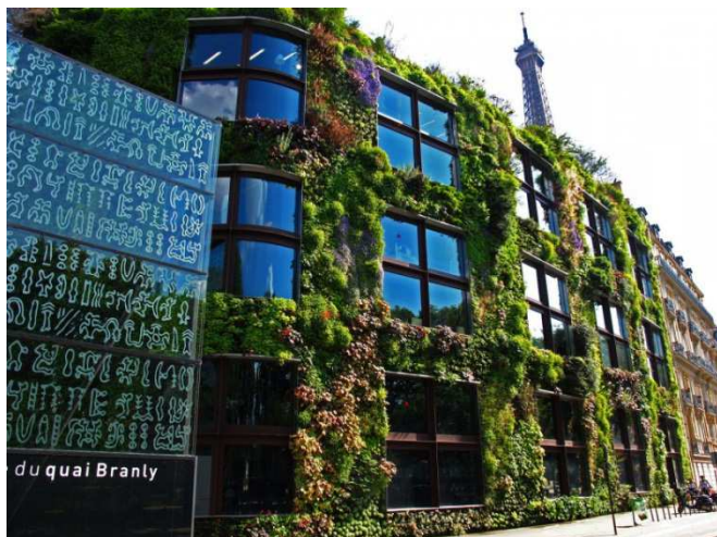
Illustration 1: Musée du quai Branly, Paris

*à l'extérieur : mettre des plantes sur les balcons , créer sur les toits des espaces verts , des jardins de fleurs ou des jardins potagers (pour récolter des fruits et légumes). On peut également végétaliser les murs avec un système qui permet de faire tenir et d' irriguer les plantes.